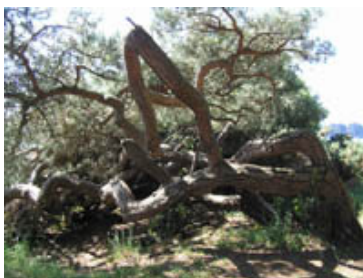
Pays de vent