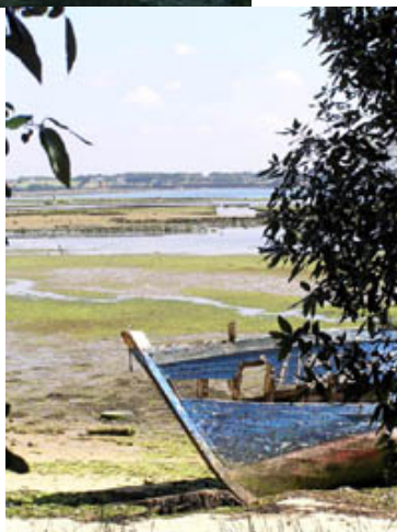
Mourir dans la mer